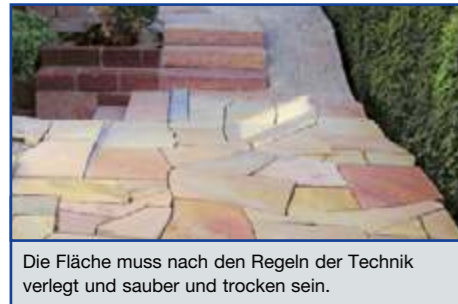
Die Fläche muss nach den Regeln der Technik verlegt und sauber und trocken sein.