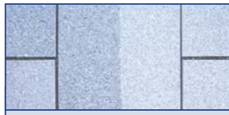
Mit Lithofin FUGEX entfernt man Reste von Pflasterfugenmörtel