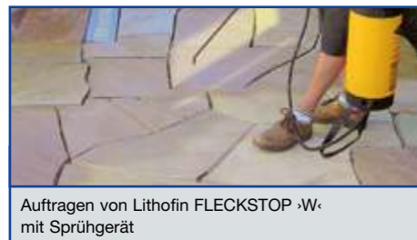
Auftragen von Lithofin FLECKSTOP ›W‹ mit Sprühgerät

Lithofin FLECKSTOP›W‹ satt und gleichmäßig auf die gesamte Fläche auftragen, bei Absätzen und Treppen müssen auch die senkrechten Flächen behandelt werden.