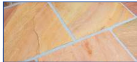
Die frisch verfugte Fläche wird zeitsparend gereinigt – sie zeigt sich klar und sauber.