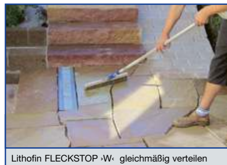
Lithofin FLECKSTOP ›W‹ gleichmäßig verteilen

Die frisch imprägnierte Fläche bis zum oberflächlichen Abtrocknen (ca. 1-2 Stunden) vor Regen und Feuchtigkeit schützen. Arbeitsgeräte reinigen Sie mit Wasser.