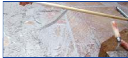
Ausfugen mit drainfähigem Epoxidharz-Fugmaterial

Flecken durch aufsteigende Feuchtigkeit können durch „Rundum-Imprägnierung“ vor dem Verlegen reduziert werden. Voraussetzung für dieses Verfahren ist, dass die Steinplatten trocken und sauber sind und in Splitt verlegt werden. Das allseitige Auftragen auf die Platte erfolgt durch Tauchen (ca. 30 Sekunden) oder Einstreichen mit einem Pinsel oder Einsprühen. Vom Material nicht aufgenommenes Produkt muss vor dem Trocknen abgewischt werden. Vor dem Verlegen oberflächlich abtrocknen lassen, da bei Verlegung im nassen Zustand ein Wirkungsverlust eintreten kann.