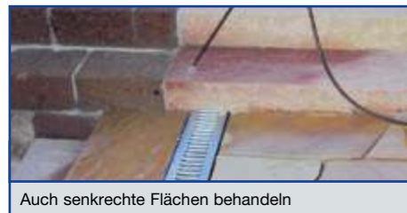
Auch senkrechte Flächen behandeln